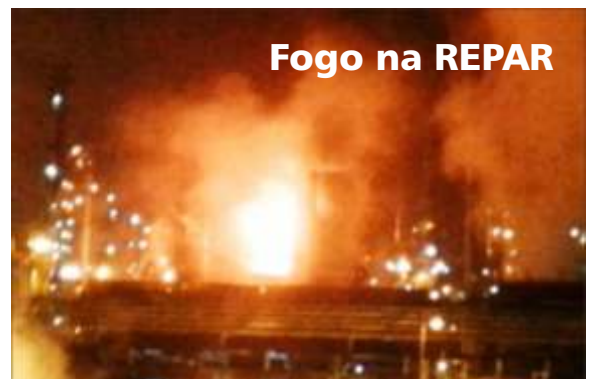
Fogo na REPAR

N as Refinarias da Petrobrás, no Itaquarão ou no Polo Petroquímico, nestes dois casos de empresas ligadas ao Grupo Odebrecht, as sucessões de acidentes graves, que se constituem em tragédias, apenas escancaram o que estamos cansados de alertar: as condições de segurança estão sendo secundarizadas em nome da redução de pessoal, precarização das condições de trabalho e terceirizações. Além, é claro, de uma economia burra, em nome dos altos lucros que não poupam nem mesmo a vida.