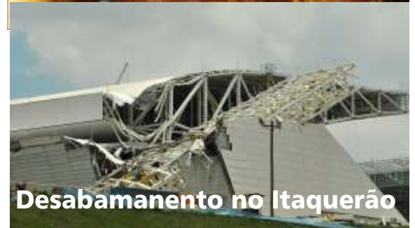
Desabamento no Itaquarão