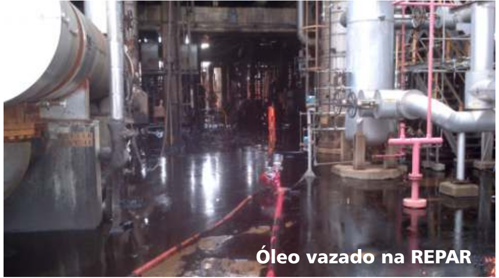
Óleo vazado na REPAR

POLO PETROQUÍMICO – Um acidente grave ocorreu na madrugada do dia 30, quando um incêndio na PP2/PE5 (antiga IPQ) atingiu a Planta Slurry na parte de refrigeração. O incêndio iniciou por volta das 3h30 e só foi totalmente controlado cerca de 10h. Foi acionado o PAM e a REFAP e UNIB enviaram brigadistas para auxiliar no evento. O acidente não teve vítimas. As primeiras informações dão conta de que pode ter ocorrido um vazamento de Hexano pelo selo de uma bomba. Durante a ocorrência foram