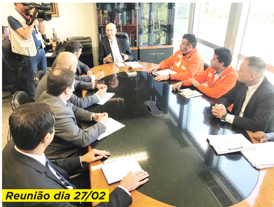
Reunião dia 27/02

Depois da reunião mediada pelo TST, no dia 21 de fevereiro, que suspendeu a greve de 21 dias da categoria, os petroleiros deram início a um processo de negociação, com a empresa, dos principais pontos que levaram à greve. Entre os temas para debate pela Comissão estão o cumprimento da Cláusula 26 do Acordo Coletivo da Ansa, que garante discussão prévia com o sindicato sobre demissões em massa - FUP, Sindiquímica-PR e Petrobrás/Ansa (reunião dia 27/02); suspensão da implantação unilateral das tabelas de turno de 3x2; o fim do interstício total e exigência dos trabalhadores chegarem na madrugada; cartões de ponto para apuração da hora extra da troca de turno; e as punições e advertências durante a greve, entre outros. LEIA MAIS NA PÁGINA 3.