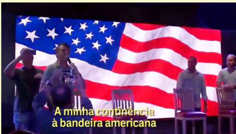
Desde que se lançou candidato, Bolsonaro tem demonstrado alinhar o país com a política dos EUA e inclusive, bateu continência à bandeira americana

Entre as primeiras medidas tomadas por Bolsonaro, esteve em destaque a redução do salário mínimo. Temer havia definido o novo valor em R$ 1.006,00. Bolsonaro definiu, por Decreto assinado no dia 1º de janeiro, em edição extra do Diário Oficial da União, que o salário mínimo, em 2019, será de R$ 998. O valor reduz a renda anual de 67 milhões de brasileiros e brasileiras, que sobrevivem com um salário mínimo por mês. Destes, 23 milhões são aposentados e 44 milhões estão na ativa. Esse foi o menor valor em 24 anos, superando para baixo até mesmo a política do governo Temer. Segundo o Dieese, o salário mínimo necessário em novembro de 2018, para despesas de uma família de quatro pessoas com alimentação, moradia, saúde, educação, vestuário, higiene, transporte, lazer e previdência, seria de R$ 3.959,98 ao mês.