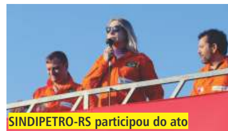
SINDIPETRO-RS participou do ato

A venda de 60% das quatro refinarias, com a consequente perda de controle da estatal sobre essas unidades, foi anunciada ao mercado no dia 27 de abril. O modelo de privatização inclui os parques industriais, terminais e malhas de dutos. O ativo Sul inclui a REPAR e a