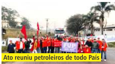
Ato reuniu petroleiros de todo País

A Refinaria Presidente Getúlio Vargas (Repar), em Araucária, Região Metropolitana de Curitiba, realizou, no último dia 17, o Ato Nacional Contra o Desmonte do Sistema Petrobrás. A manifestação vem sendo chamada pela FUP e realizada em todas as refinarias ameaçadas de privatização pelo governo golpista e ilegítimo de miSHELL Temer (MDB). A REPAR é uma das quatro refinarias que foram colocadas à venda em abril, junto com 1.506 quilômetros de oleodutos e 12 terminais da Transpetro. No RS, a atividade, que também contou com representações da FUP e de petroleiros