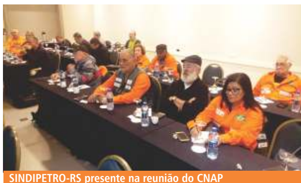
SINDIPETRO-RS presente na reunião do CNAP

O SINDIPETRO-RS participou, no dia 27 de junho, da reunião do Conselho Nacional dos Aposentados da FUP (CNAP), que ocorreu em Curitiba.