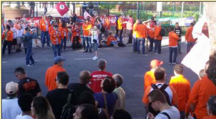
Ato em frente a administração da Petrobrás na BA

Os petroleiros de diversos estados que participaram do XVII CONFUP estiveram presentes no ato contra a venda de ativos da Petrobrás na Bahia na sexta-feira, dia 4. A atividade foi em frente à Torre Pituba, a principal base administrativa da empresa no estado. A FUP e os sindicatos chegaram a bloquear parte da Avenida Antônio Carlos Magalhães, que dá acesso ao edifício.