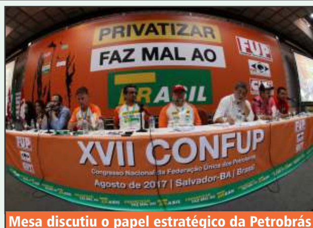
Mesa discutiu o papel estratégico da Petrobrás