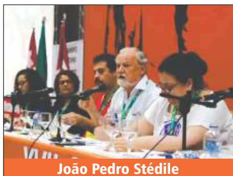
João Pedro Stédile

A mesa foi concluída com a explanação de João Pedro Stédile. O líder do MST falou sobre as sequências do golpe: explorar a classe trabalhadora para aumentar o lucro dos empresários; assaltar o bem natureza, principalmente o petróleo; assaltar os recursos públicos, recolhendo esse recurso acumulado; subordinar a nossa economia ao sistema norte americano; e, por último, a privatização