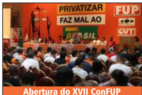
Abertura do XVII ConfUP

À noite teve a solenidade de abertura do XVII CONFUP.