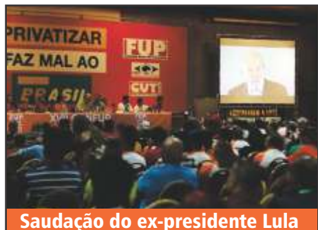
Saudação do ex-presidente Lula

Lula tem sido presença constante na luta dos petroleiros contra o desmonte da Petrobrás e foi durante seu governo que a empresa foi fortalecida, assim como interrompido o processo de privatização que vinha sendo implantado pelo mesmo Pedro Parente durante o governo FHC.