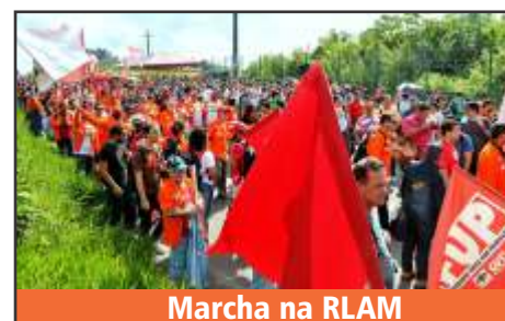
Marcha na RLAM

Ainda na quinta-feira (3), na parte da tarde foi feita a aprovação do regimento interno, eleição da mesa diretora e